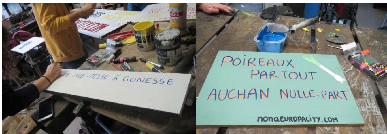
Atelier "pancartes" : les artistes en plein travail

Vous souhaitez soutenir la lutte contre EuropaCity et pour le projet CARMA de manière visible et pérenne, alors adoptez une pancarte et plantez-la dans votre jardin ou posez-la sur votre balcon ... l'essentiel est qu'elle soit bien visible de l'extérieur.