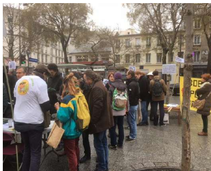
Le CPTG sur la place à Ménilmontant le 16 décembre aux côtés des représentants des autres luttes du Grand Paris